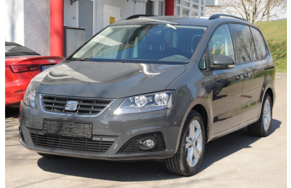
Tagesangebot Nr. AK-89080 vom 24.03.2018

Energieträgerkosten bei 20.000km, Kraftstoff Diesel mit 1,1 Euro/l: 1166 Euro.