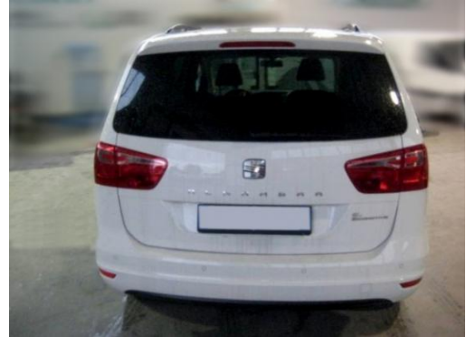
Tagesangebot Nr. AK-89052 vom 24.03.2018