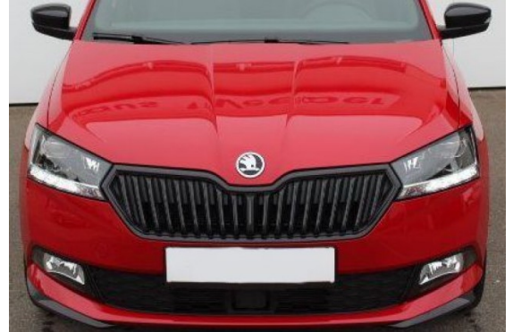
Tagesangebot Nr. AK-92812 vom 25.02.2019

Energieträgerkosten bei 20.000km, Kraftstoff Super E10 mit 1,349 Euro/l: 1241,08 Euro.