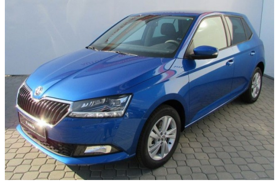
Tagesangebot Nr. AK-92811 vom 25.02.2019

Energieträgerkosten bei 20.000km, Kraftstoff Super E10 mit 1,349 Euro/l: 1241,08 Euro.