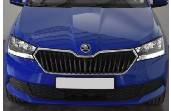
Tagesangebot Nr. AK-92804 vom 25.02.2019

Energieträgerkosten bei 20.000km, Kraftstoff Super E10 mit 1,349 Euro/l: 1322,02 Euro.