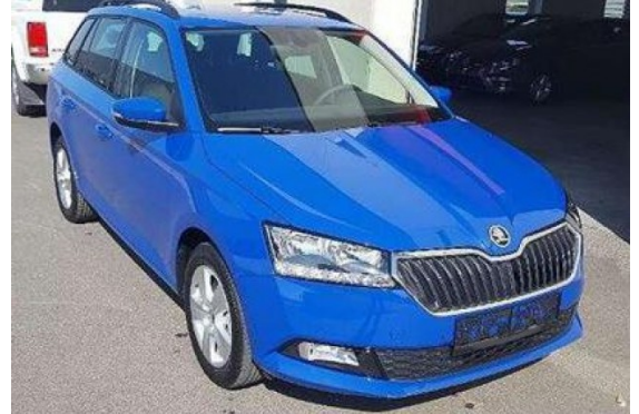
Tagesangebot Nr. AK-92821 vom 25.02.2019

Energieträgerkosten bei 20.000km, Kraftstoff Super E10 mit 1,349 Euro/l: 1322,02 Euro.