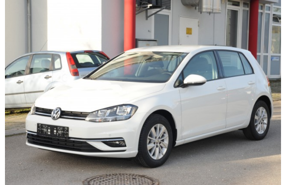
Tagesangebot Nr. K-88379 vom 17.02.2018

Energieträgerkosten bei 20.000km, Kraftstoff Super E10 mit 1,283 Euro/l: 1385,64 Euro.