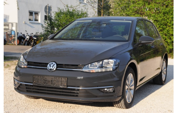
Tagesangebot Nr. AK-92671 vom 17.02.2019