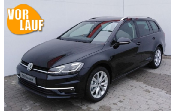
Tagesangebot Nr. K-92731 vom 18.02.2019

Energieträgerkosten bei 20.000km, Kraftstoff Super E10 mit 1,349 Euro/l: 1.429,94 Euro.