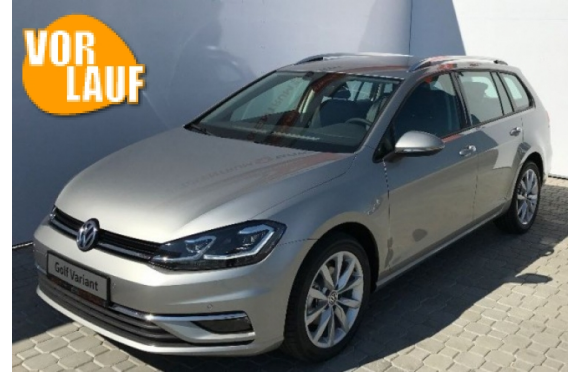
Tagesangebot Nr. K-92738 vom 18.02.2019

Energieträgerkosten bei 20.000km, Kraftstoff Super E10 mit 1,349 Euro/l: 1.402,96 Euro.