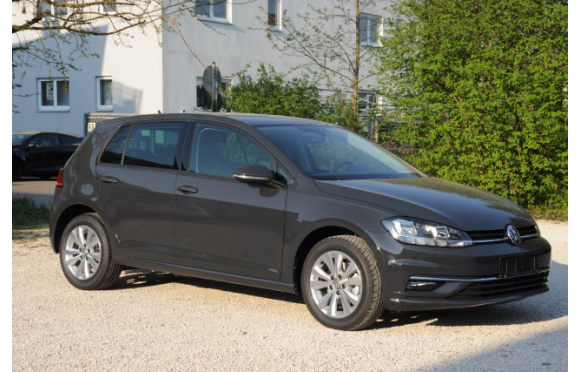
Tagesangebot Nr. AK-92677 vom 17.02.2019

Energieträgerkosten bei 20.000km, Kraftstoff Super E10 mit 1,349 Euro/l: 1429,94 Euro.