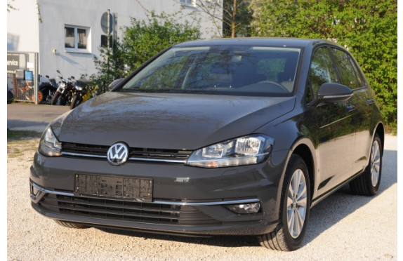
Tagesangebot Nr. AK-92680 vom 17.02.2019

Energieträgerkosten bei 20.000km, Kraftstoff Super E10 mit 1,349 Euro/l: 1402,96 Euro.