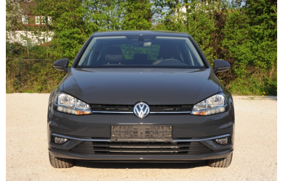
Tagesangebot Nr. AK-92698 vom 17.02.2019