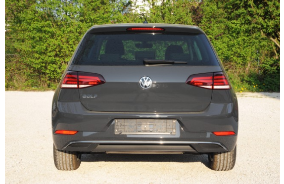
Tagesangebot Nr. AK-92695 vom 17.02.2019