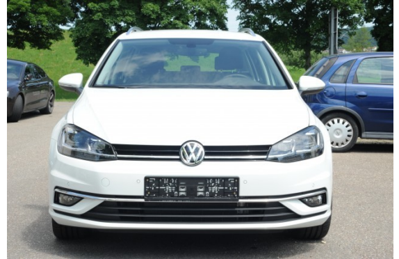
Tagesangebot Nr. AK-92723 vom 17.02.2019