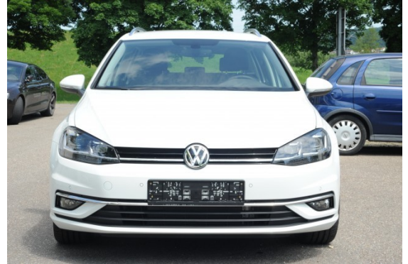
Tagesangebot Nr. AK-92720 vom 17.02.2019