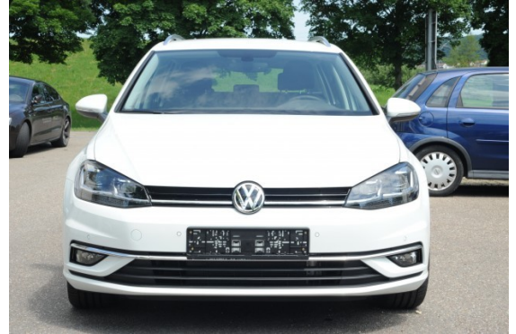
Tagesangebot Nr. AK-92722 vom 17.02.2019

Energieträgerkosten bei 20.000km, Kraftstoff Super E10 mit 1,349 Euro/l: 1915,58 Euro.