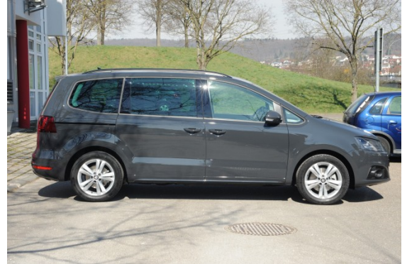
Tagesangebot Nr. AK-89062 vom 24.03.2018