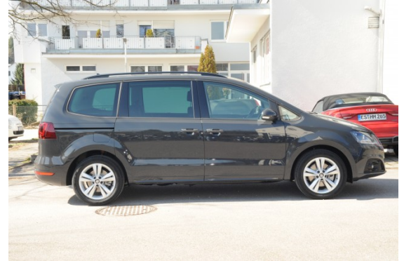
Tagesangebot Nr. AK-89079 vom 24.03.2018

Energieträgerkosten bei 20.000km, Kraftstoff Diesel mit 1,1 Euro/l: 1166 Euro.