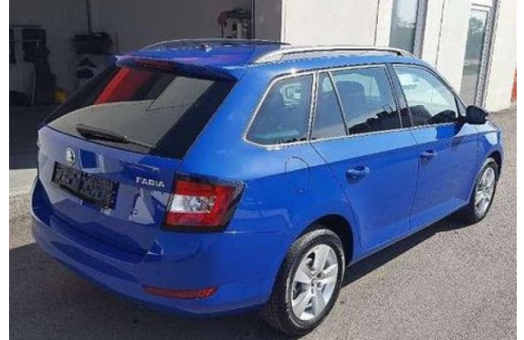
Tagesangebot Nr. AK-92826 vom 25.02.2019

Energieträgerkosten bei 20.000km, Kraftstoff Super E10 mit 1,349 Euro/l: 1241,08 Euro.