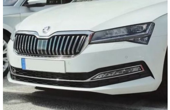
Tagesangebot Nr. AK-94343 vom 06.10.2019