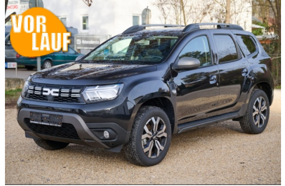
Tagesangebot Nr. K-106484 vom 27.02.2024